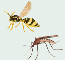
WESP / MUG